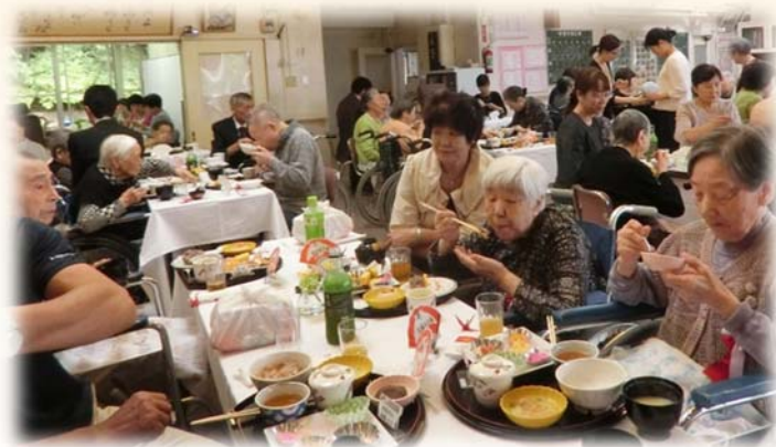
たくさんのご家族においでいただきました。

9月15日、海松園ホールにて、ご来賓・ご家族をお招きして敬老会を行いました。 来賓よりご挨拶いただいた後、施設長より各居室の代表者へ記念品の贈呈がありました。 アトラクションでは、利用者から歌を披露していただきました。