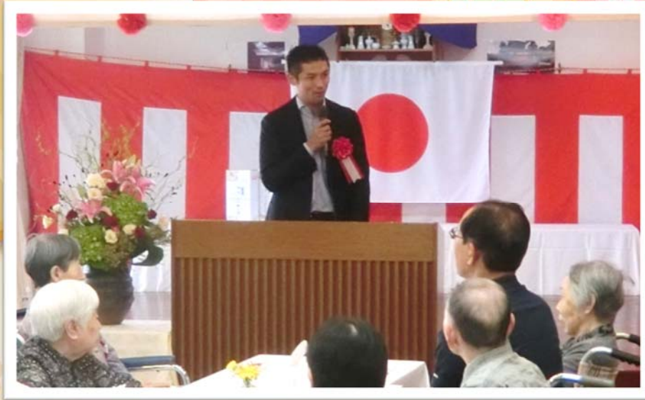
衆議院議員寺田学様よりお祝いの言葉をいただきました。