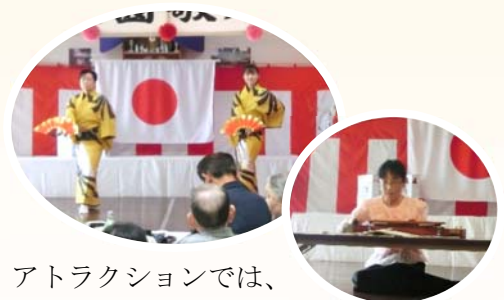
アトラクションでは、宝扇流優扇会社中の舞踊と大正琴研究会の演奏を観賞しました。