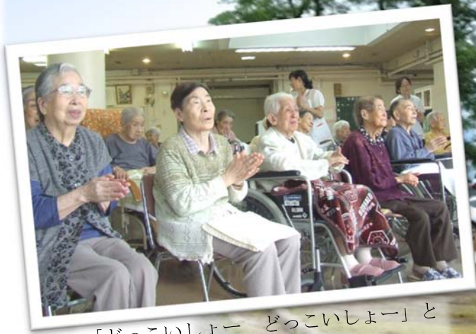
「どっこいしょー どっこいしょー」と自然に掛け声が上がりました。

8月5日、上亀之丁竿燈会のみなさんが来園しました。 間近で見る迫力ある演技には歓声が上がっていました。可愛らしい小若の妙技に涙ぐむ方もいらっしゃいました。