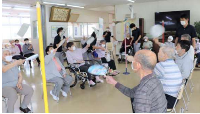
すっきりおなじみ フライングペーパー