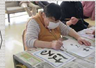
新年は書初めで 気持ち集中！