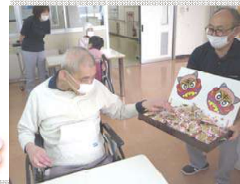
鬼は～外～！福は～内～！ そして疫病退散